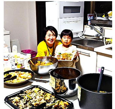
孤食防止・居場所づくりなどを行う子ども食堂支援のために