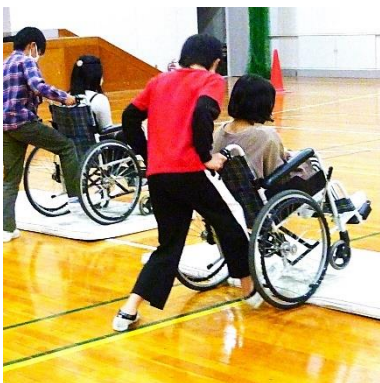
福祉への理解と関心を深めてもらうために(福祉実践教室)