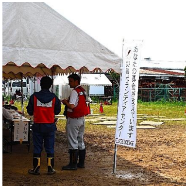
災害時のボランティア活動など被災地を支援するために