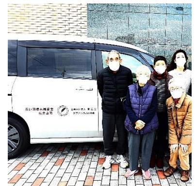
福祉施設の利用者などを送迎するために

お問い合わせ 愛知県共同募金会 TEL : 052-212-5528 愛西市共同募金委員会 TEL : 0567-37-3313