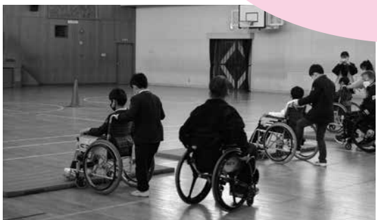
福祉実践教室 小中学校を中心に行っています。