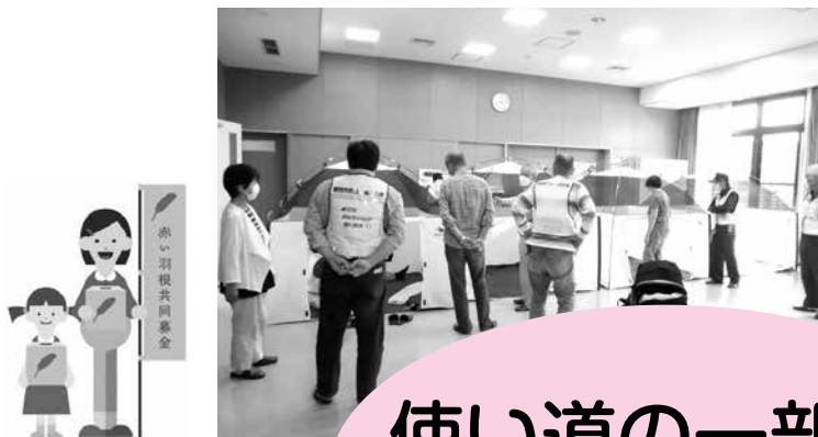
避難所体験講座 簡易テント設営体験 を行いました。