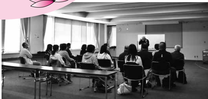
昨年度は聴覚障害者と災害ボランティア講座を行いました。