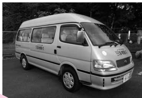
買い物支援バスの運行 市内在住のひとり暮らし高 齢者などを対象に、買い物 に不便を感じている人をお 店まで送迎するサービスです。